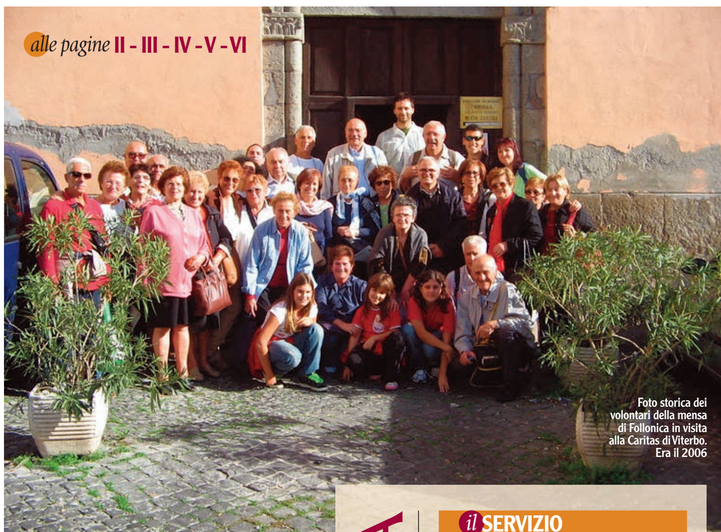
Foto storica dei volontari della mensa di Follonica in visita alla Caritas di Viterbo. Era il 2006