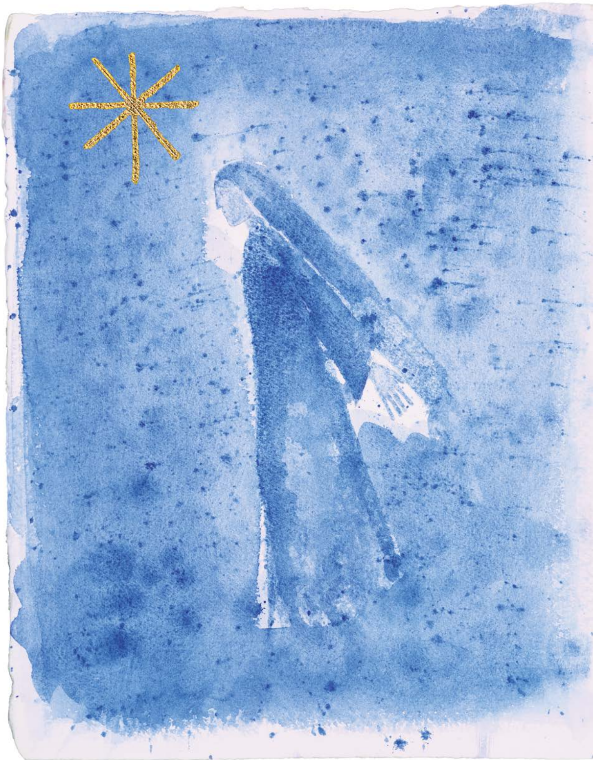
M. Paladino, Messale Romano, p. 614