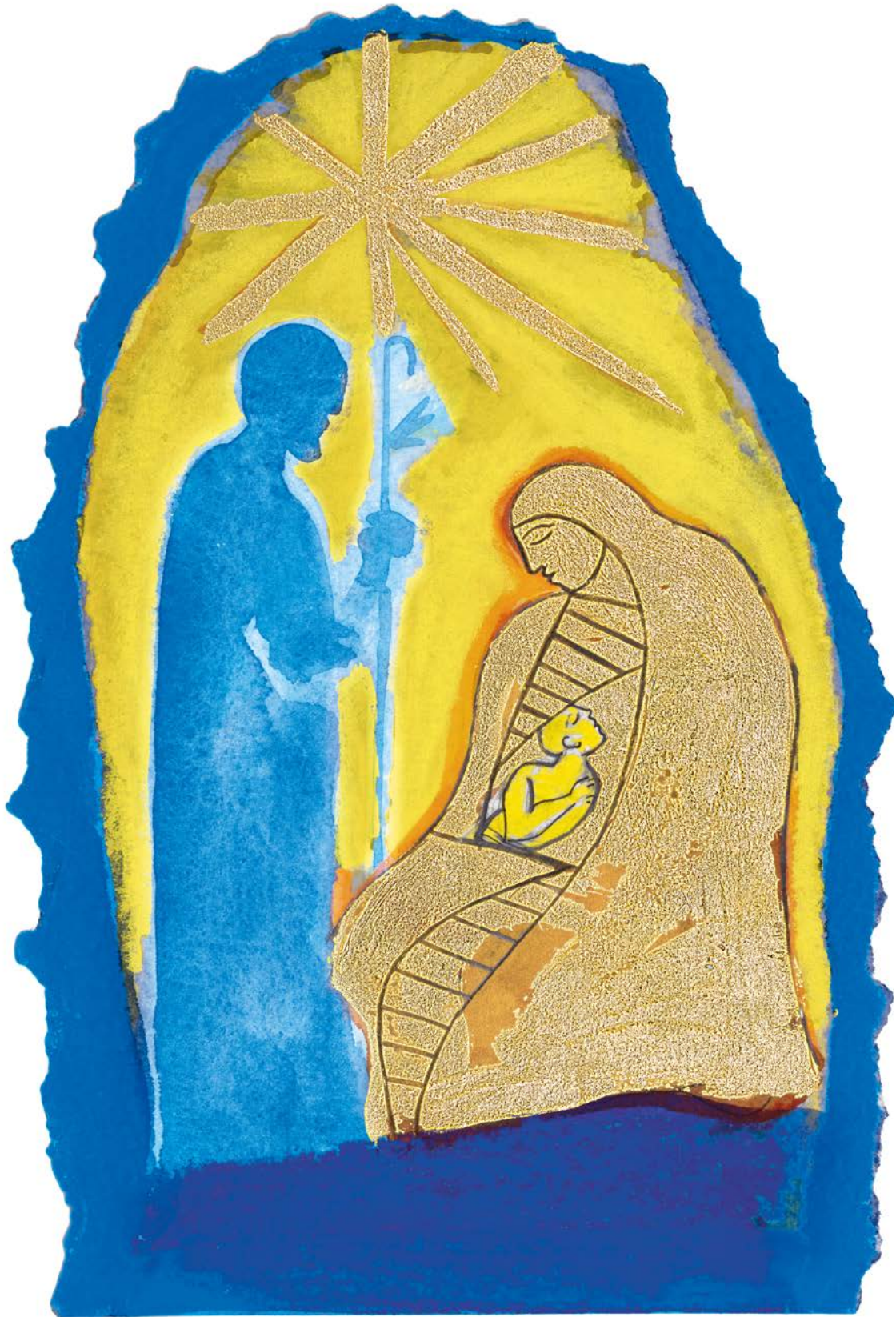
M. Paladino, Messale Romano, p. 614