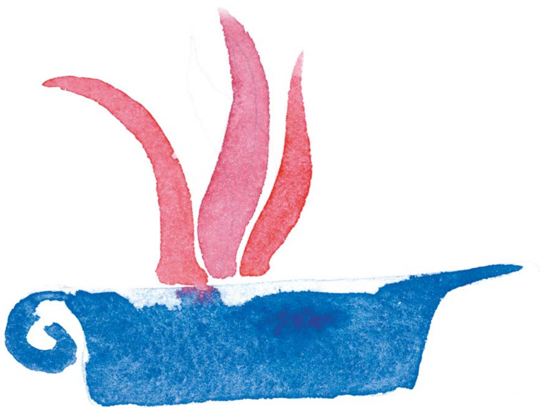
M. Paladino, Messale Romano, pp. 2-3, particolare